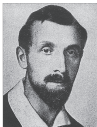
図3 ディナル人種=北方人種