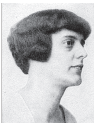
図2 主に西方人種—北方人種の特徴も