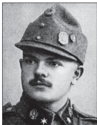
図4 東方人種=ディナル人種