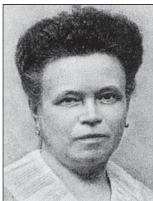
図5 主に東方バルト人種—東方人種の特徴も